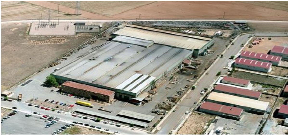
Instalaciones de la compañía PYRSA en Monreal del Campo (Teruel)