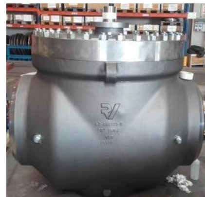
Equipo de PYRSA y detalle de alguna de las piezas producidas